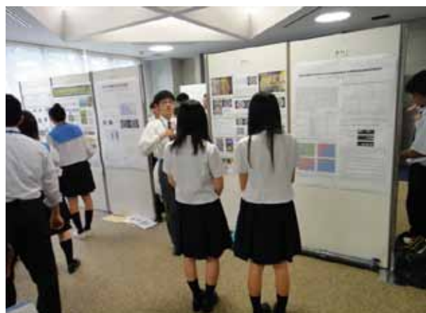
ポスター発表(A5 藤土)

岡山大学大学院自然科学研究科、環境生命科学研究科は2006年より、「高校生・大学院生による研究紹介と交流の会」を開催しています。本校から、生徒4名が初めてこの交流会に参加し、発表しました。参加者は、ステージやポスター発表を通じて、科学への理解と興味を深めました。