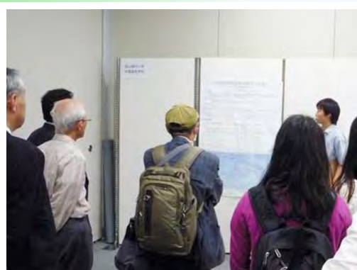
大学の先生や理化学研究所の方々に 対してポスターの前で質疑応答