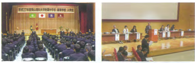
4月9日休 第54回入学式 新入生397名