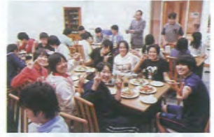
3年生 加計学園御津国際交流会館