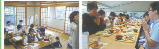
1年生 国立吉備少年自然の家