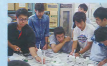
岡山大学・岡山理科大学の協力を得て、テーマ別に実験・観察、英語でのプレゼンテーション