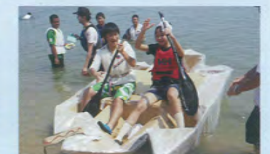
牛窓の海で、レース