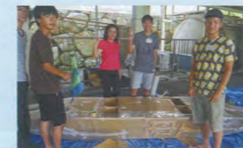
前島研修所にて、日タイ合同チームでダンボールボート製作

生徒たちは、タイの高校生との科学探究活動を経験し、グローバルな視点をもって、日常の学習にも取り組む必要性を感じたようです。平成28年1月5日~10日(5泊6日)には本校の生徒10名がタイのセントドミニク高校・カセサート大学で交流を深めたり、日系企業を訪問するインターナショナルサイエンスキャンプinタイが実施されました。