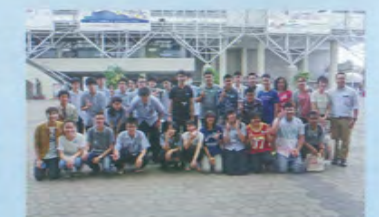
インテック大阪にて、SSH 全国大会を見学